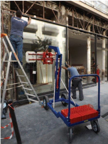
VL500 avec chariot Big foot