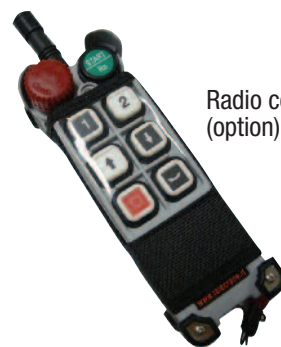
Radio commande (option)