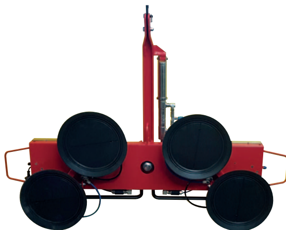
Rotation des ventouses (option disponible sur le palonnier DSKE D2)