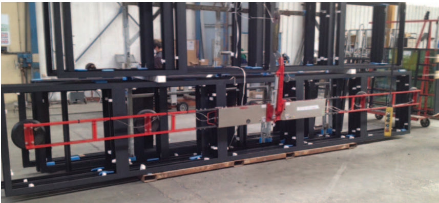
DSKE2 format XXL