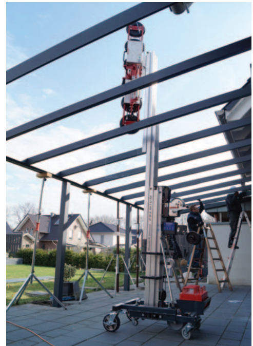
DSKE2 avec chariot WLU KS 5.1