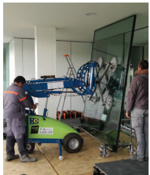
Chariot HDL avec robot de pose Winlet 600.