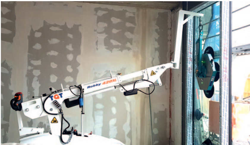
ROBBY 420 XL avec option potence surélevée .